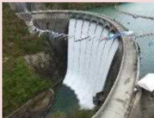
なるこ ①鳴子ダム 【宮城県大崎市】