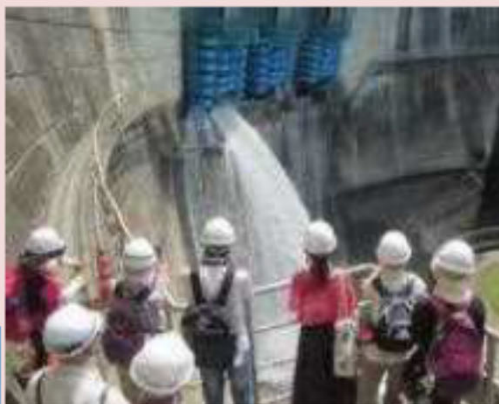
あまがせ ③天ヶ瀬ダム 【京都府宇治市】