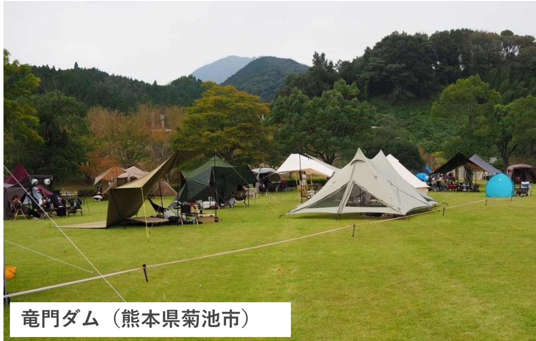
竜門ダム（熊本県菊池市）