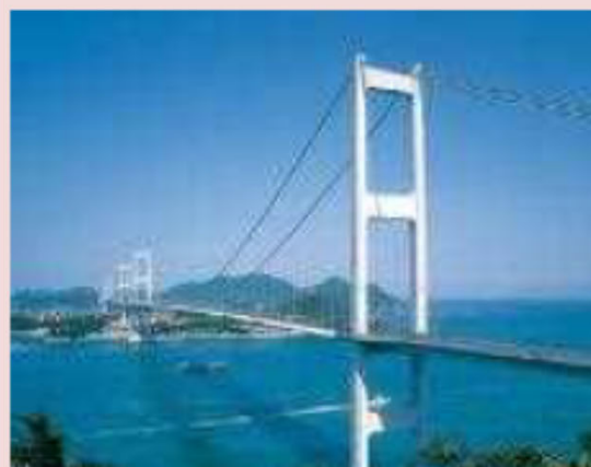
くるしま ④来島海峡大橋 【愛媛県今治市】