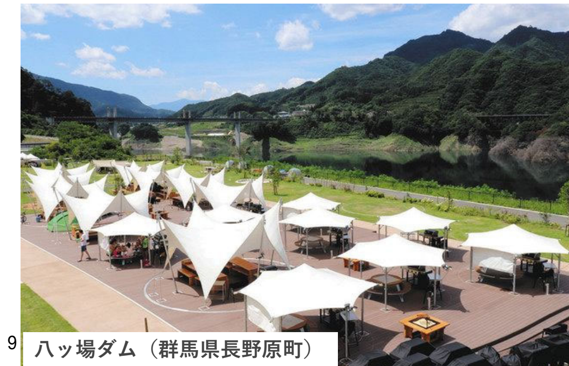
9 ハッ場ダム（群馬県長野原町）