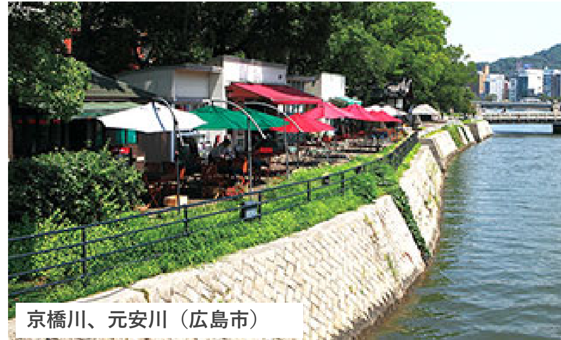
京橋川、元安川（広島市）